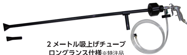
2メートル吸上げチューブ ロングランス仕様※特注品