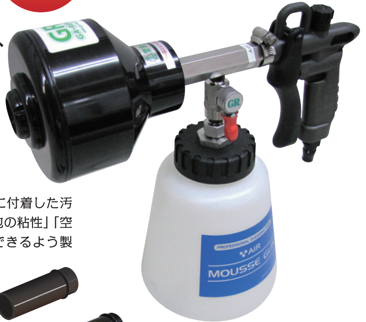
AMG-PH※特注品 (弱アルカリ・弱酸性洗剤対応仕様)