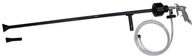
CD-AMG-1W-T ※特注品 (ロングランス仕様)