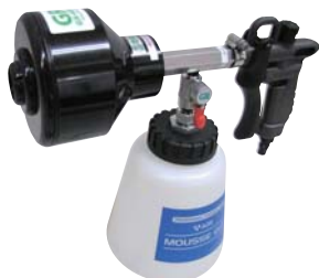
AMG-PH ※特注品 (弱アルカリ・弱酸性洗剤対応仕様)